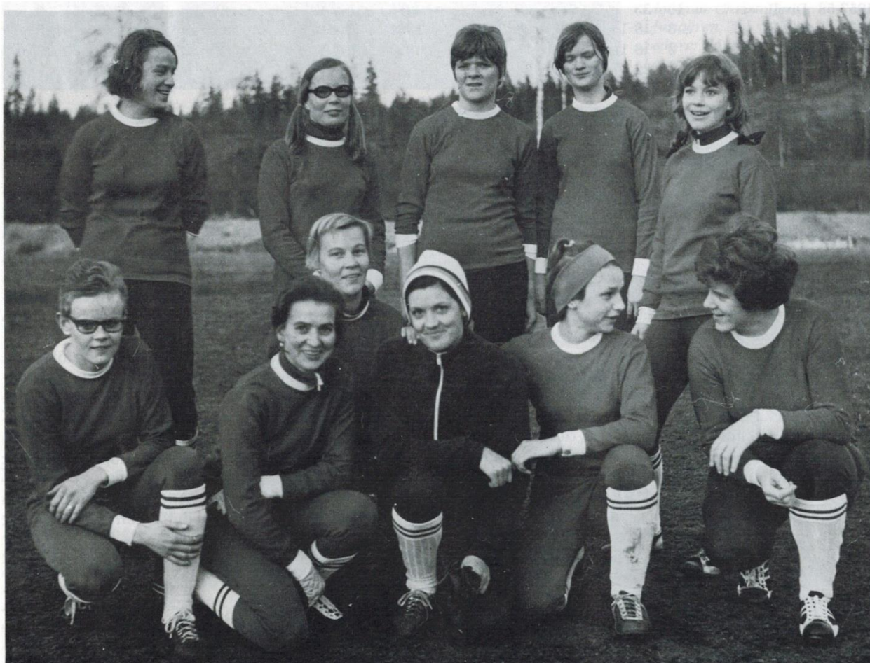
Inför seriedebut i Markgruppen 1969 genrepade TIF:s damlag mot Smålands Burseryd (seger 5—2).

Det har även funnits damfotboll i Tranemo IF. Den första epoken varade under åren 1966-71. Första damlaget i seriespel var 1969 och det kan ni se på bilden nedan.